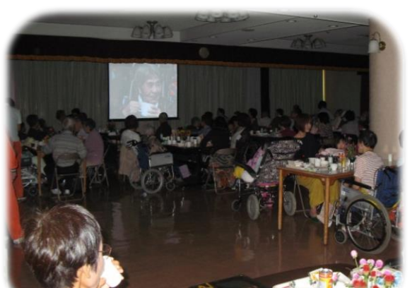
▲スライドショーの上映