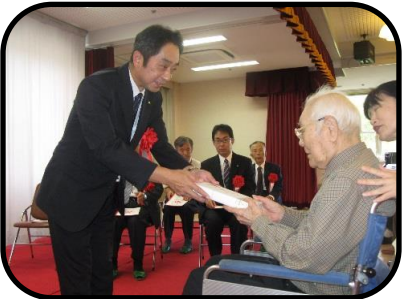
▲美祢市より記念品の贈呈