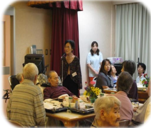
▲御家族による詩吟の披露

9月18日に特別養護老人ホーム幸嶺園、ケアハウス幸嶺園で家族会を開催し、約100名もの御家族に御参加頂き大変賑やかに開催する事が出来ました。今年の家族会では新たに3年以上受賞されている御家族へ、ブロンズファミリー賞、ブロンズワIFE賞の授賞式も行い、記念写真と表彰状の授与をしました。会食会では、今年も職員有志による余興を行い腹踊り、千手観音の披露をしました。また、利用者さんも御家族も一緒に食事をされ「家族と食べるご飯はおいしいね」と大変喜ばれました。そして最後は毎年大好評のスライドショーの上映を行いました。1年間の思い出がたくさん詰まったスライドを利用者さんは御家族と一緒に笑顔で楽しまれ拍手喝采でした。今年の家族会、会食会も会場が穏やかで和やかな雰囲気になりました。