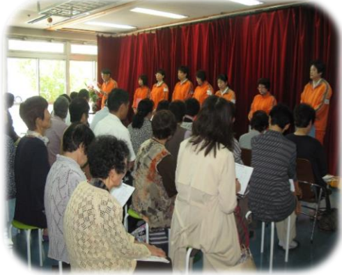
▲各施設の進捗状況の発表