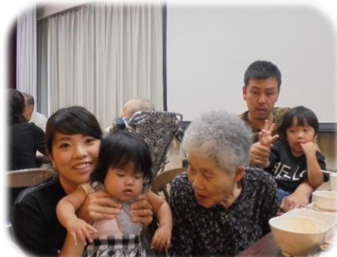
▲お孫さんとの団樂に笑顔が溢れます