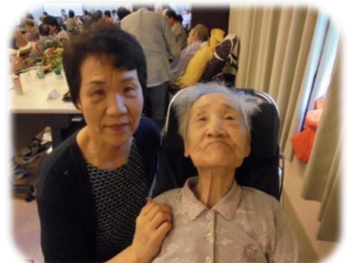
▲娘さんと心地よい時間を過ごされました