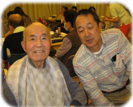
▲息子さんとの楽しい一時に笑みがこぼれました