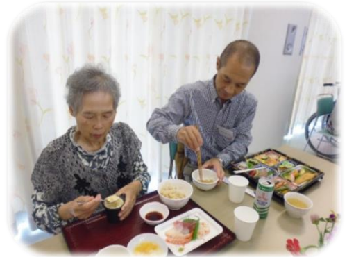
▲御家族と美味しい食事を堪能されました