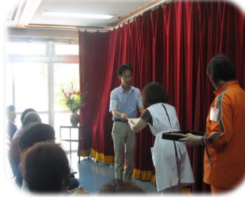
▲ベストファミリー賞、ファミリー賞の表彰式