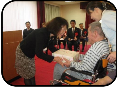
▲周美会より記念品の贈呈